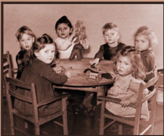
Kinderbetreuung um 1920